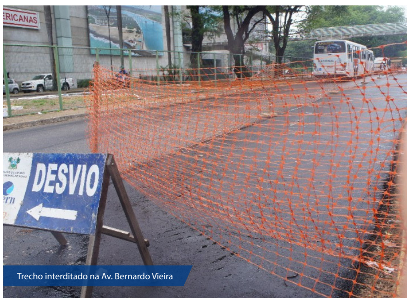
Trecho interditado na Av. Bernardo Vieira

Obra de implantação de rede de esgotamento sanitário que estava sendo realizada nas imediações da Avenida Bernardo Vieira já foi to-