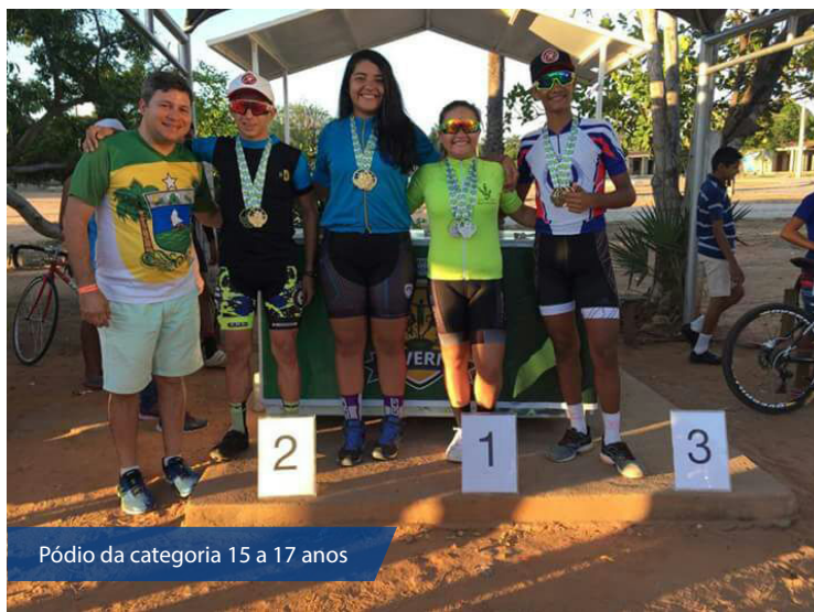
Pódio da categoria 15 a 17 anos

Os campeões representarão o Rio Grande do Norte na fase nacional dos Jogos Escolares em Curitiba e