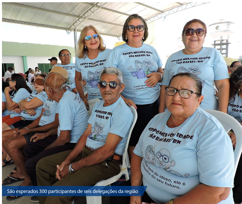
São esperados 300 participantes de seis delegações da região

Criado pela Secretaria de Estado do Esporte e do Lazer (SEEL) com o objetivo estimular a participação das pessoas da terceira idade em atividades esportivas e recreativas, os Jogos da Maturidade acumulam milhares de participantes. Em três anos, o projeto já recebeu idosos de Natal, São Gonçalo do Amarante, Brejinho, Baía Formosa, Guamaré, São José de Mipibu, Viçosa, Umarizal, Rodolfo Fernandes, Itaú, Portalegre, Riacho da Cruz, Angicos, Ipanguaçu, São Rafael, Lajes, Fernando Pedroza, Parauá, Pedro Avelino e Pendências.