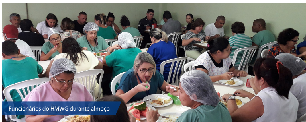
Funcionários do HMWG durante almoço

Nenhum trabalhador pode oferecer o seu melhor desempenho caso não esteja bem alimentado. Em um ambiente onde a assistência à saúde é prioridade, é essencial estar devidamente nutrido e com energia suficiente para cumprir a jornada diária de trabalho. No Hospital Monsenhor